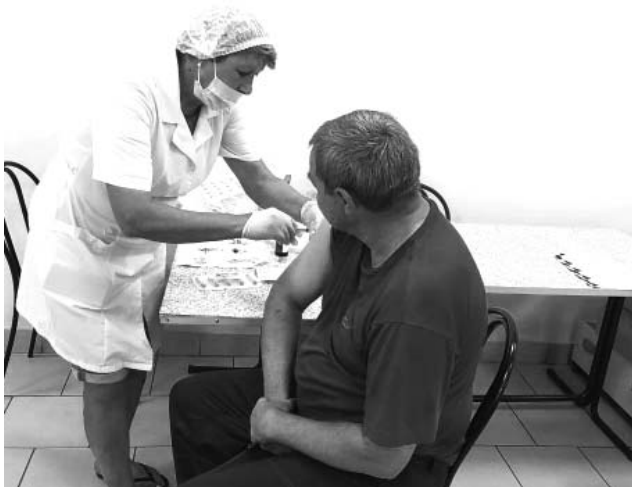
Вакцинация в ООО «ДПК».

Как сделать прививку в думиничской поликлинике, вас проконсультируют по тел. 8-48-447-9-12-43 (регистратура).